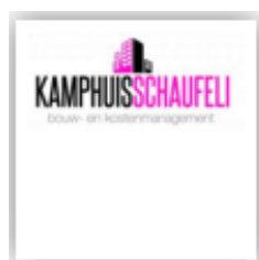
Kamphuis schaufeli http://www.ksbkm.nl